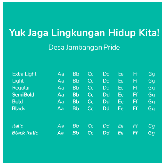
Gambar 9. Tipografi

yang sederhana dan minimalis, sehingga cocok untuk desain yang ingin menekankan konsep keindahan lingkungan yang hijau. Penggunaan font ini membuat audience dapat menikmati materi video animasi tanpa rasa bingung dan bosan saat membaca copy visual yang ditampilkan pada video animasi Motion Graphic .