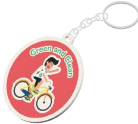
Gambar 4. Gantungan Kunci