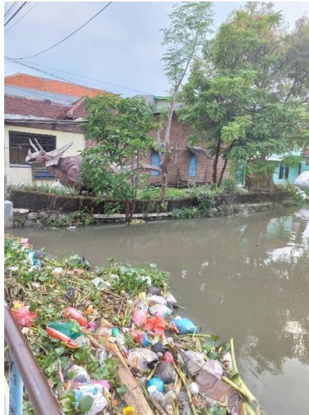
Gambar 1. Kondisi Sampah yang menumpuk di sungai di Surabaya

Kebersihan lingkungan merupakan suatu keadaan yang bebas dari segala kotoran dan penyakit, yang dapat merugikan segala aspek yang menyangkut setiap kegiatan dan perilaku lingkungan masyarakat, di mana kehidupan manusia tidak bisa dipisahkan baik lingkungan alam maupun lingkungan sosial (Lastriyah, 2011).