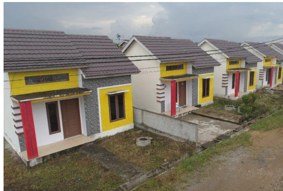
Gambar 10. Acuan desain environment

Environment yang digunakan dalam Video Animasi Motion Graphic ini menggunakan lingkungan yang berada di Kampung Jambangan dan lingkungan di Indonesia pada umumnya.