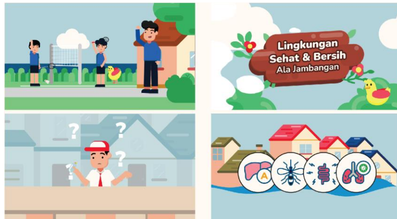
Gambar 2. Implementasi Media Utama