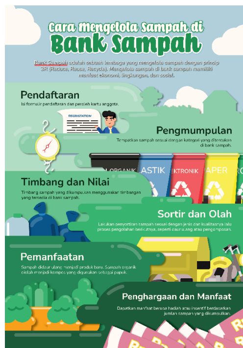
Gambar 3. Poster

Poster merupakan media pendukung yang akan dibuat sebagai media promosi agar audience mengetahui adanya video animasi Motion Graphic . Poster ini nantinya akan dipasang di Balai Kampung Jambangan.