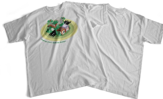
Gambar 5. Kaos

Kaos merupakan media pendukung yang dapat dibeli secara terpisah dengan jumlah yang terbatas.