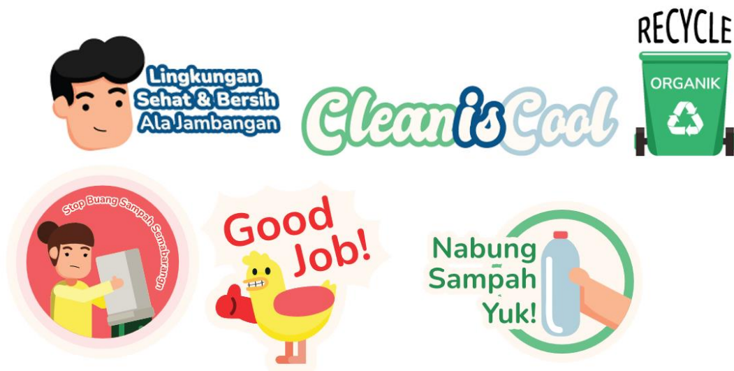
Gambar 6. Stiker dan GIF Instagram