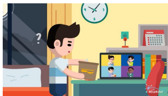
Gambar 8. Referensi warna

Warna yang akan digunakan dalam Perancangan ini adalah warna yang memiliki warna cerah untuk membangun mood yang bahagia. Kombinasi warna yang netral seperti hijau atau biru, serta menghindari penggunaan warna-warna yang terlalu mencolok atau terlalu banyak detail.